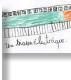
Un train électrique.