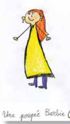
Une poupée Barbie