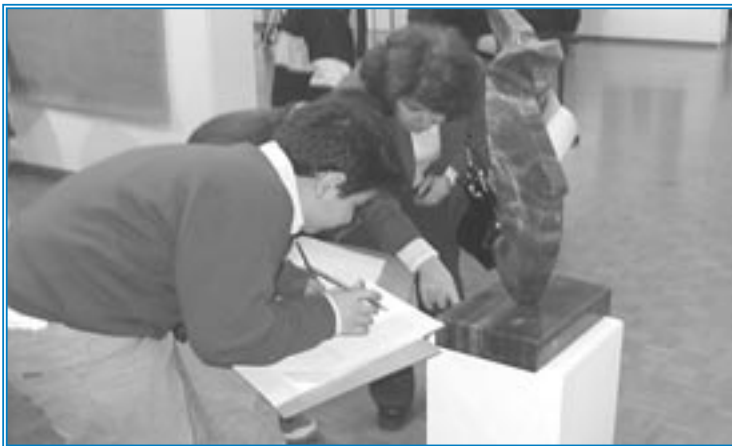
Les élèves de la EB5

La visite au musée était très intéressante. On a découvert des artistes fabuleux. Les questions étaient faciles, mais choisir les plus belles toiles était une mission difficile. Quand au dessin qu'on a fait avec plaisir, c'est aussi un chef-d'oeuvre!!!