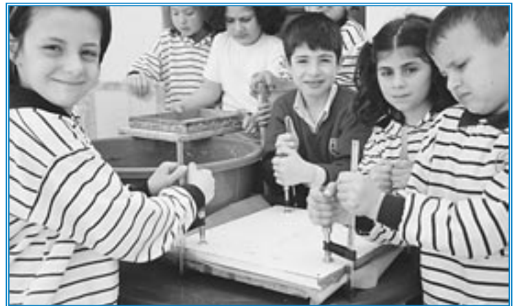
Les élèves de la EB3

Grâce à cette activité, nous avons compris l'importance de n'importe quel objet à jeter et nous nous sommes habitués à bien placer les ordures dans les poubelles convenables.